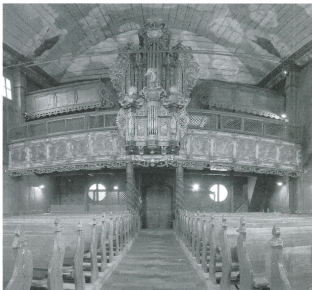
Drevený artikulárny kostol v Kežmarku. Kostol je zapísaný ako národná kultúrna pamiatka Unesco.