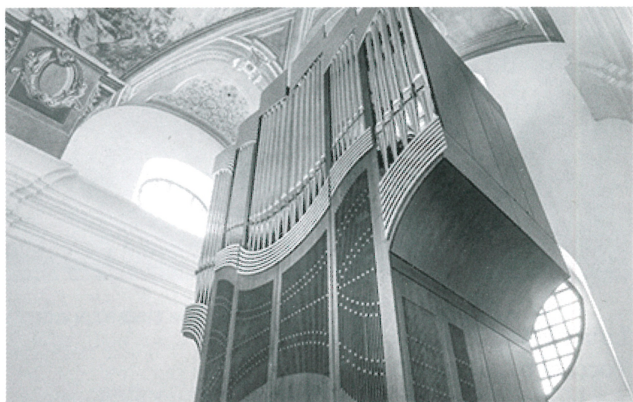
Organ v Seminárnom kostole sv. Antona Paduánskeho v Košiciach