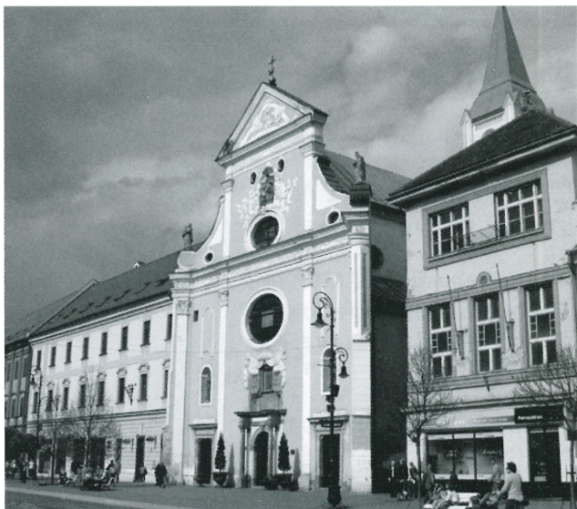
Seminárny kostol sv. Antona Paduánskeho v Košiciach