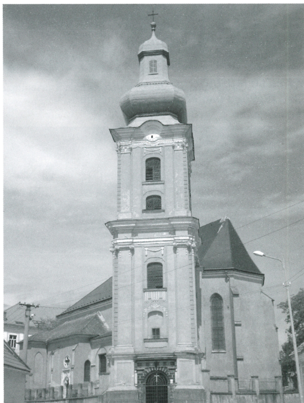
Katedrála Nanebovzatia Panny Márie v Rožňave