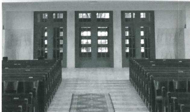
Organ v Konkatedrále Sedembolestnej Panny Márie v Poprade