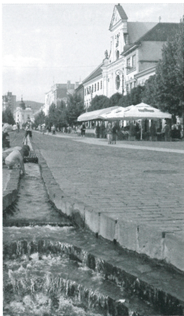
Hlavná ulica v Košiciach, pohľad na kostol sv. Antona Paduánskeho