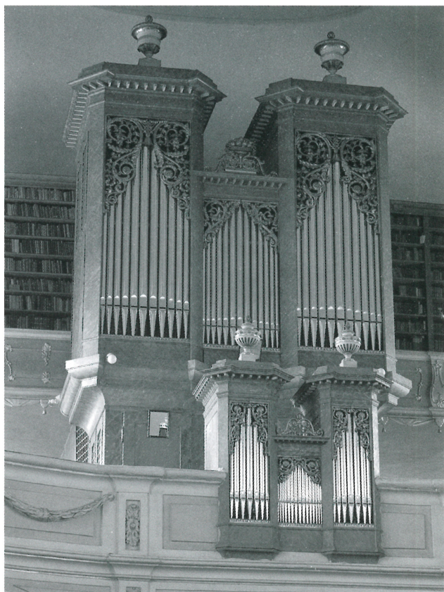
Organ v Evanjelickom kostole v Spišskej Novej Vsi