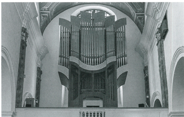
Organ v Seminárnom kostole sv. Antona Paduánskeho v Košiciach