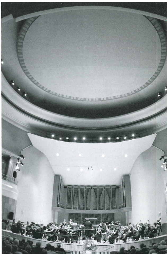
Koncertná sála Domu umenia