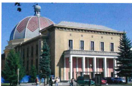
Dom umenia – sídlo ŠFK